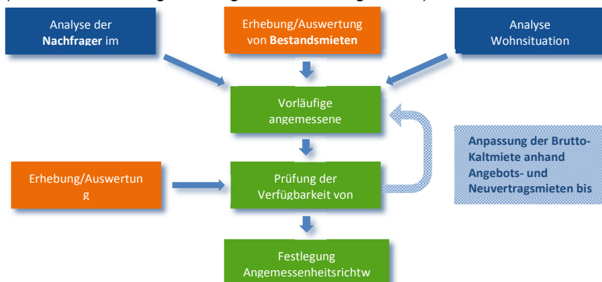
Abbildung 4 (Iterative Ermittlung von Angemessenheitsgrenzen):

Ausgehend von der Analyse der Nachfragegruppen und der bisherigen Wohnsituation der Leistungsempfänger wird basierend auf den Bestandsmieten ein vorläufiger Richtwert abgeleitet. Dieser Richtwert wird dem Preisniveau der erhobenen Angebots- und Neuvertragsmieten gegenübergestellt. Innerhalb eines iterativen Verfahrens zur Anpassung der Richtwerte wird sichergestellt, dass auch eine Neuvermietung von Wohnraum in Höhe der Richtwerte in hinreichendem Umfang möglich ist.